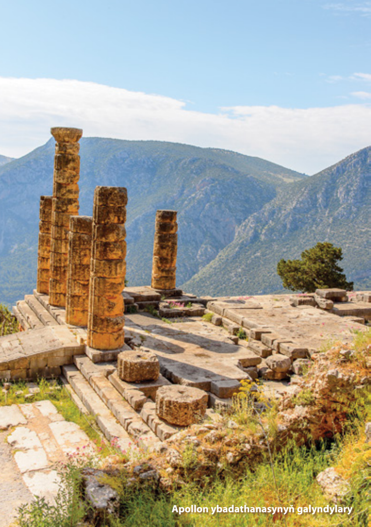
Apollon ybadathanasynyň galyndylary