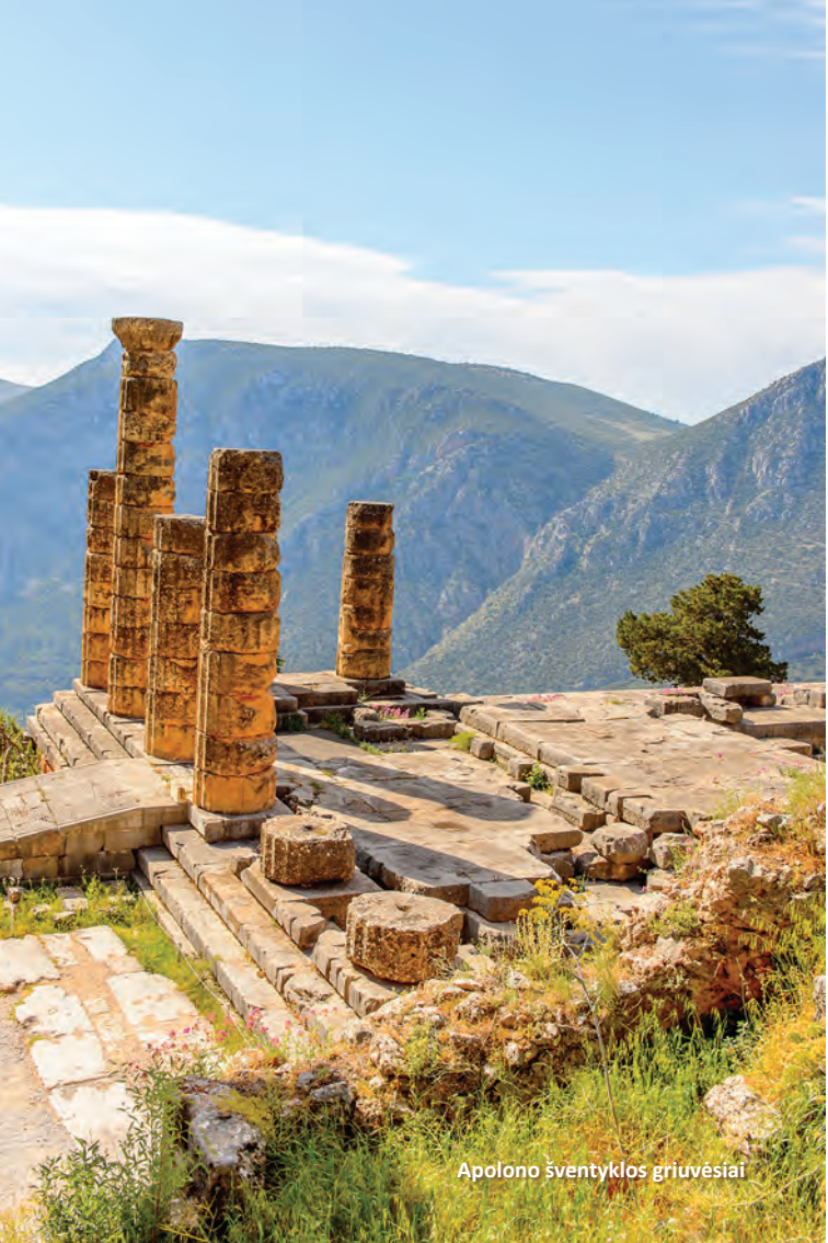
Apolono šventyklos griuvėsiai