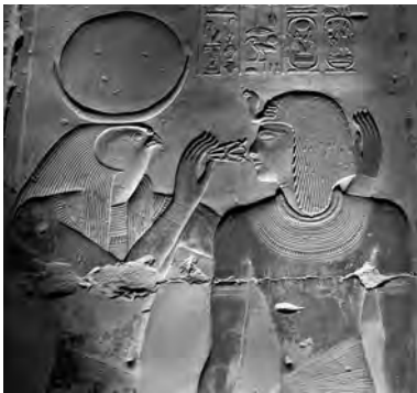
Сети и Ра в Абидосе

Теперь обратим внимание на храм Сети I в Абидосе. Расположенный примерно в пятистах километрах от Каира, этот храм был посвящен Сети I, Осирису, Исиде, а также Птаху, Птах-Сокару, Нефертуму, Ра-Горахти, Амону и Гору. Хотя он посещается не