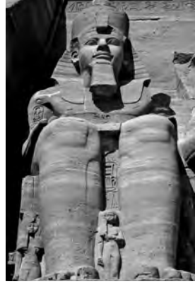
Колосс храма Абу-Симбел

Этот храм строился двадцать лет, с начала правления Рамсеса II; поэтому, чтобы узнать дату постройки, нужно узнать, когда начал править Рамсес II. Если Рол прав, отождествляя Сусакаима с Рамсесом II, то традиционное датирование храма 1224 г. до н. э. следует пересмотреть. Строительство Абу-Симбела началось в первое десятилетие правления Рамсеса, где-то между 960 и 930 гг. до н. э. по новой хронологии. Если же пользоваться поправкой в 200 лет, то строительство осуществлялось между 1040 и 1010 гг. до н. э. В любом случае, исход из Египта и постройка скинии произошли намного раньше, чем был построен Абу-Симбел. ✓