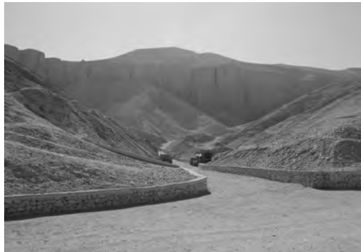
Долина Царей, Египет

Но вот в чем состоит аномалия. Когда кураторы Каирского музея развернули мумию Джедптахиуфанха (довольно скромного чиновника из Карнака, чья мумия была найдена в той же гробнице), они увидели, что повязки были датированы одиннадцатым годом фараона Шешонка, то есть 934 г. до н. э. по традиционной хронологии. Вы видите, в чем проблема? Каким образом саркофаг Джедптахиуфанха мог быть размещен в самом низу колодца примерно через тридцать четыре года после того, как саркофаг Сети I был положен с самого верха, а колодец был запечатан? Чтобы отмахнуться от этой аномалии, ученые предположили, что гробница была еще раз вскрыта позднее, чтобы добавить Джедптахиуфанха. Однако саркофаг