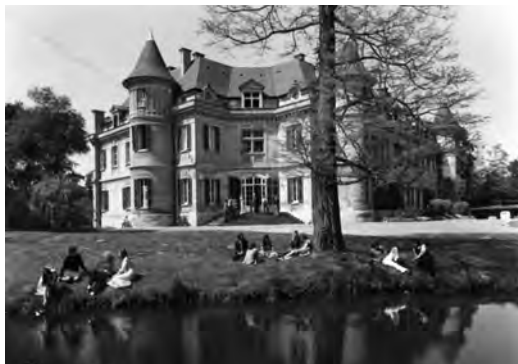
Здание Европейского библейского института. Ламорле, Франция

В том году у нас подобрался уникальный студенческий коллектив. Эти молодые люди отличались огромным энтузиазмом. Меня поражала их пылкая любовь к археологии; дошло до того, что они попросили у администрации разрешения (и получили его) на проведение собственных раскопок на участке возле замка.