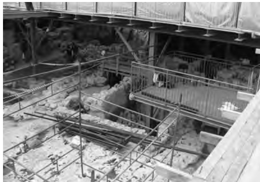
Раскопки города Давида, Иерусалим, Израиль

В центре основного зала синагоги площадью 120 м 2 археологи обнаружили необычный камень, на котором была выгравирована менора – подсвечник на семь свечей. «Мы имеем дело с