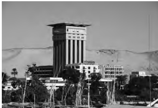
Отель «Мовенпик» на Элефантине. Египет

«Когда услышал Санаваллат, что мы строим стену, он рассердился