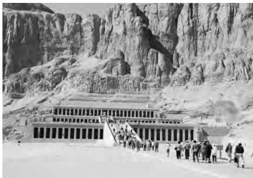
Поминальный храм царицы Хатшепсут (он же храм Дейр-эль-Бахри) в окрестностях Луксора. Египет

Далее мы переходим к поминальным храмам в Дейр-эль-Бахри. Во времена Среднего и Нового царств рядом с гробницами фарао-