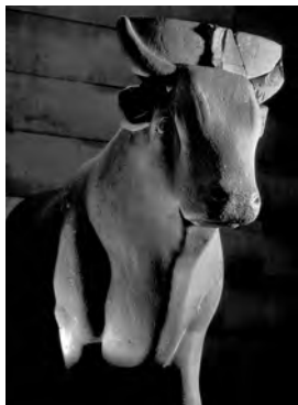
Бык Апис из Саккары. Лувр

Стела 31 с места захоронения Аписов (так называемая «стела Пасенхора», которая сейчас находится в парижском Лувре) явно дает понять, что одному фараону мог соответствовать только один Апис. Есть археологические данные о том, что в галереях Серапеума в Саккаре было захоронено не более