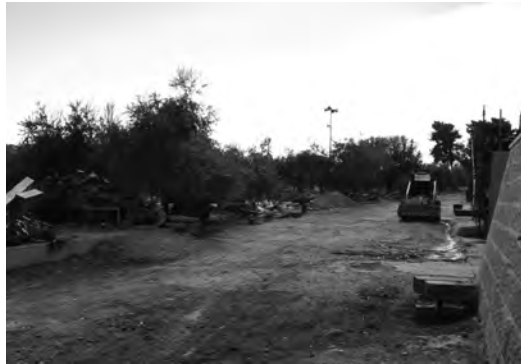
Затяжное строительство разрушает артефакты у Храмовой горы

Израильские археологи были разгневаны тем, что Вакуф пустил в ход бульдозеры для раскопок ворот XII столетия, построенных крестоносцами, с целью использования этих ворот как запасного выхода из мечети: