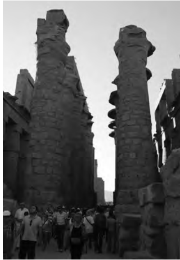
Карнак, древние Фивы, окрестности Луксора. Египет

В рамках нашего обсуждения важно вспомнить праздничную процессию статуй царской семьи, которая стала традицией при Восемнадцатой династии. Процессия начиналась в Карнаке и заканчивалась в храме в Луксоре, а весь праздник продолжался одиннадцать дней. В конце правления Восемнадцатой династии процессия проходила по Нилу. Каждый бог или богиня помещались на отдельный плот, который тянули небольшие лодки. По берегам реки шли толпы народа, сопровождая своих богов; в толпах были воины, музыканты, танцовщики и важные государственные лица. Ко времени правления Рамсеса III из Двадцатой династии празднование растянулось до двадцати семи дней. Записи указывают, что в то время на празднике раздавалось более 11000 хлебов, 85 пирогов и 385 кувшинов пива. Во время праздника люди могли молиться статуям фараонов и богов, проплывавшим на плотах, испрашивая у них тех или иных благ. Прибыв в храм, фараон и его жрецы заходили в тайную комнату. Там происходило слияние фараона и его «ка» – божественной сущности фараона, данной ему от рождения, и фараон становился божеством. Едва ли комнату, где проходил этот обряд, можно назвать «Святым святых».