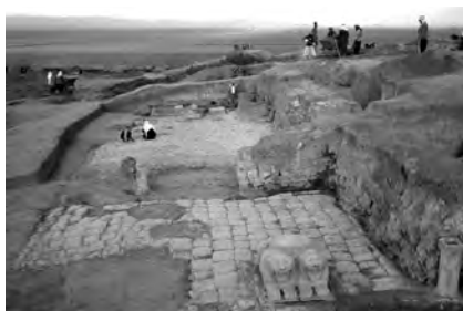
Храм Телль-Тайинат в долине Аму. Турция