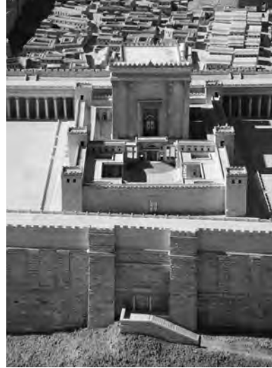
Модель Второго храма (т. н. «храма Ирода»).

Прежде чем мы перейдем к следующему разделу, хочу указать, что Божественное откровение Моисею по поводу конкретных