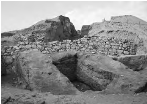
Тель-ас-Султан (ветхозаветный Иерихон)

К концу первого курса магистратуры в Израиле я начал ощущать тревожные последствия своего знакомства со множеством учебников, с профессорами, археологами, древними текстами и местами археологических раскопок, такими как Тель-ас-Султан (Иерихон). Однажды на выходных я написал несколько писем своим бывшим