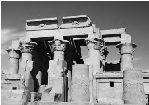
Храм в Ком-Омбо. Египет

Как ответить на этот вопрос? Как реагировать на заявления, что израильтяне позаимствовали планировку своего храма (в том числе Святого святых), а также обряды поклонения у языческих религий Ближнего Востока, что они изобрели свою религию собственным, человеческим, разумом? Этот вопрос напоминает извечное: «Что старше – курица или яйцо?» К счастью, есть достаточно данных, чтобы на него ответить, если вы готовы карабкаться на