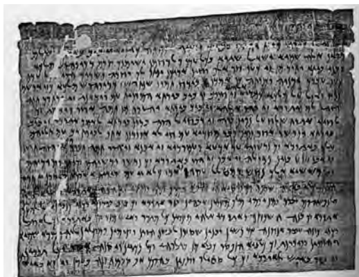
Элефантинский «пасхальный папирус» № 34 10

В древние времена этот остров играл стратегическую роль как в обороне, так и в торговле. Там уже более ста лет проводят раскопки и реконструкции различные команды археологов из Германии. За прошедшие века на Элефантине неоднократно велись строительные