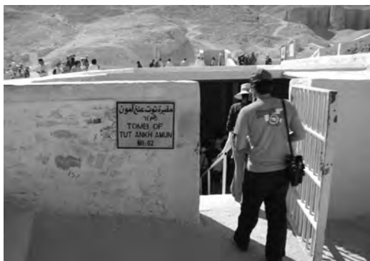
Вход в гробницу Тутанхамона в Долине Царей, Египет

Британский египтолог Хью Эвелин-Уайт, уважаемый ученый и сотрудник Оксфордского университета, одним из первых вошел в гробницу Тутанхамона (находящуюся в Долине Царей) после ее обнаружения в 1922 году. Через два года, в возрасте сорока лет, он совершил самоубийство. Почему? Единственный ключ к разгадке – записка, которую он написал за несколько минут до повешения (говорят, что собственной кровью, но, вероятно, это мистификация): «Я навлек на себя проклятье». Эвелин-Уайт считал, что стал жертвой потустороннего духовного явления. Как гласит легенда, поскольку члены экспедиции «нарушили покой» фараона, все они, за исключением Говарда Картера, умерли вскоре после посещения гробницы. Арчибалд Дуглас Рид, который делал рентген мумии Тутанхамона прежде, чем ту перевезли в Каирский музей, на следующий день