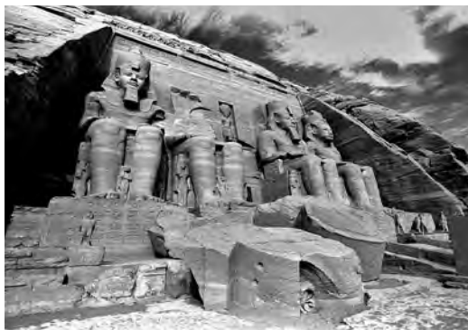
Фасад храма Абу-Симбел

Если вы подниметесь по лестнице большого храма, пройдете между двумя колоссальными статуями сидящего Рамсеса, прямо