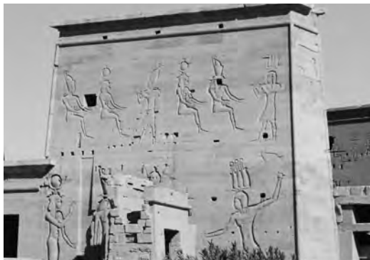
Храм Исиды в храмовом комплексе на острове Филы. Египет

Простой ответ, на первое время, – это тоже зависит от вашего мировоззрения. Чтобы найти более распространенный ответ, про-