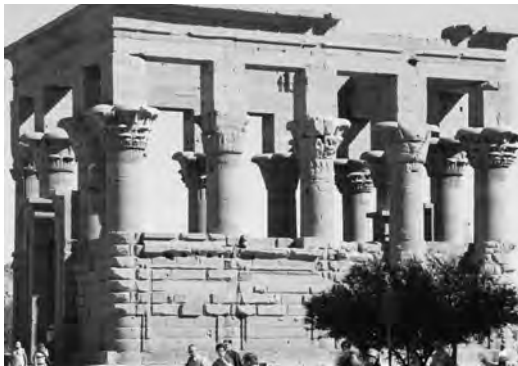
Палатка Траяна в храмовом комплексе на острове Филы. Египет

жертвоприношений в языческих храмах в Египте (мы поговорим об этом подробнее в следующей главе).