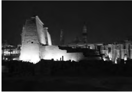
Луксорский храм на восточном берегу Нила. Египет

и все надеющиеся на них (Псалом 113:10–16).