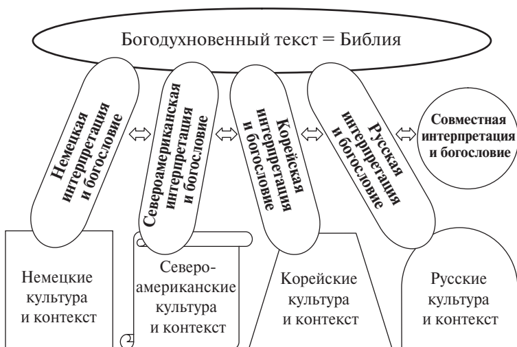
Схема 1. Исследование Писания в локальной и глобальной культурах

Как было упомянуто выше, библейский текст должен читаться и пониматься в Церкви и это происходит в соответствующем контексте и культуре. Очень часто в прошлом этот факт пытались обойти и игнорировать как нерелевантный. При этом речь обычно идет о следующих параметрах, объясняемых на такой модели (схема 1):