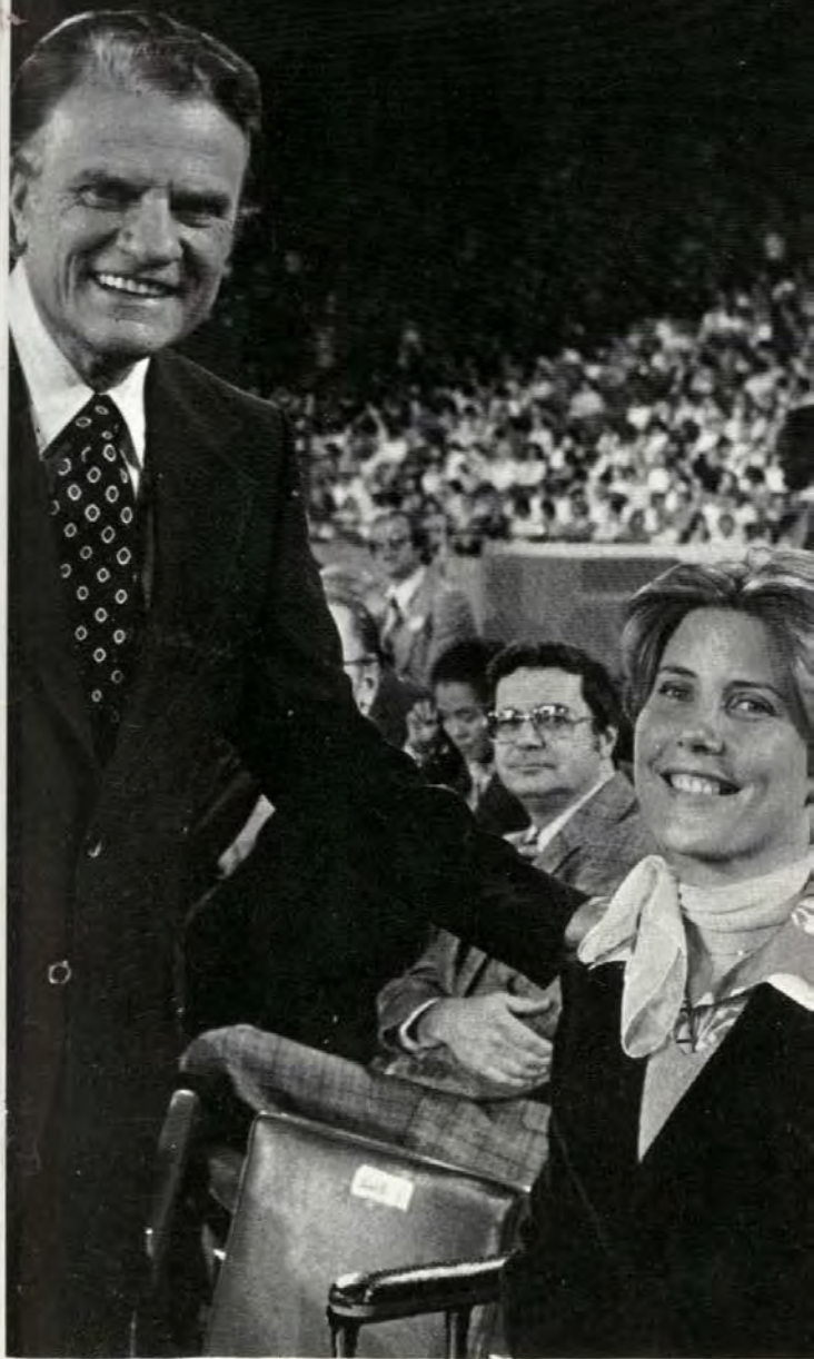
Джони и Билли Грэм в 1977 г.