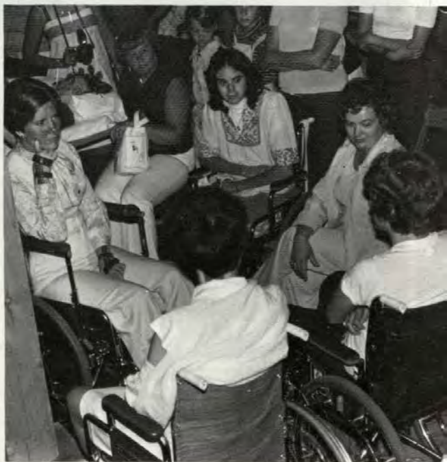
В беседе с инвалидам