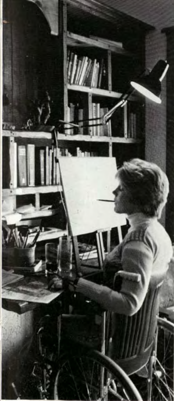
Джони за письменным столом в своем кабинете.